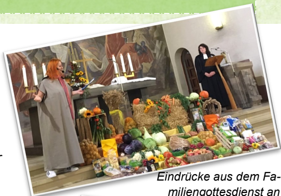
Eindrücke aus dem Familiengottesdienst an Erntedank