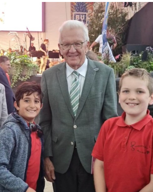
Das Foto zeigt unsere beiden jüngsten Trompeter mit dem Ministerpräsidenten.

Traditionell haben wir den Erntedankgottesdienst im Evangelischen Altenzentrum und die Wo-