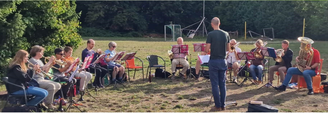
Der Posaunenchor OpenAir auf dem CVJM-Platz

che darauf den Gottesdienst in der Lutherkirche mitgestaltet.