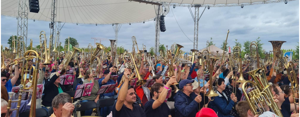
Zahlreiche Bläser und Bläserinnen waren beim Landesposaunentag in Mannheim.

Ein musikalisch erfülltes Jahr neigt sich dem Ende zu. Wir blicken auf zahlreiche Einsätze des Posaunenchor im Sommer zurück. Wir durften beim Gottesdienst zum 50. Jubiläum der Forster Dietrich-Bonhoeffer-Gemeinde spielen, haben einen Gottesdienst des CVJM zusammen mit der EMK-Bruchsal und deren Posaunenchor auf unserem schönen Vereinsgelände gestaltet und erlebten zwei