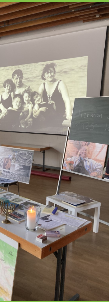
e - eine Geschichte vom m Holocaust

che Elemente nicht fehlten. Eine Zeitreise, die stellvertretend für viele Schicksale steht und den Anwesenden noch lange im Gedächtnis bleiben wird.