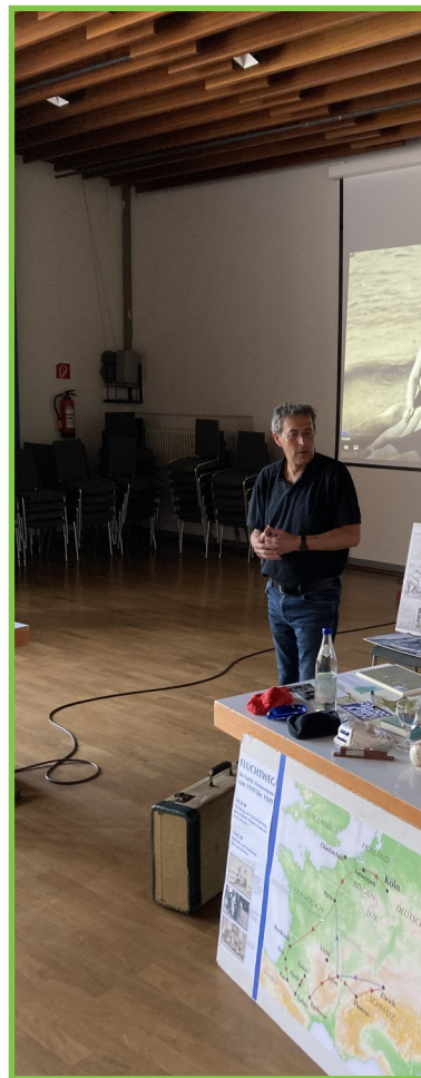
Ein Engel an meiner Seite Überleben in