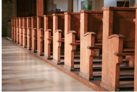
In den Kirchenbänken finden Besucher*innen der Offenen Kirche Stille und Ruhe.

hat sie alle eingeladen. Auch durch die Ausstellung im Oktober kamen Menschen in die offene Kirche. Und so begegnet man den Besucher*innen und kommt ins Gespräch, über die Bezugspunkte zur Lutherkirche, über Glauben und Religion, ja buchstäblich über „Gott und die Welt“. Gerade durch die unterschiedlichen Besucher*innen entwickeln