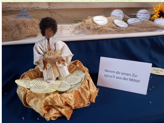
Das Bodenbild zu Erntedank gab unterschiedliche Impulse zum „Dank(en)“