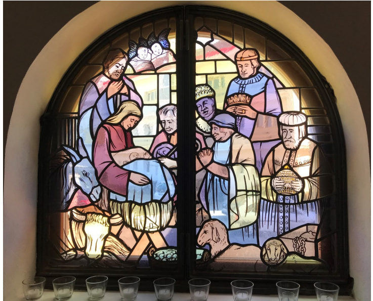
Das Weihnachtsfenster im Gebetsraum unserer Lutherkirche.

Maria und Josef beugen sich – wie hier im Fenster unseres Gebetsraumes – über den neu geborenen Jesus, in dem Gott in unsere gebrochene Welt gekommen ist. Darüber freuen wir uns: Gott kümmert sich und wird diese Welt erneuern. - Die Engel darüber weisen hin: Gott ist in Jesus schon angekommen! Gott will mit uns Menschen zu tun haben und alle Welt retten!