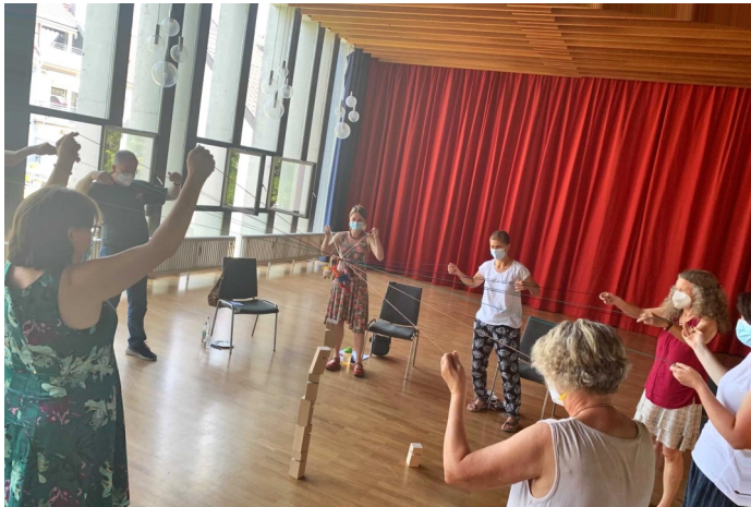
Tag 2 der Gemeindeberatung: Gemeinsam an der Zukunft der Luthergemeinde bauen

Damit wir uns schon jetzt auf den Weg machen, haben wir zum Schluss "smarte" Ziele, d.h. umsetzbare Ziele formuliert, die in naher Zukunft umgesetzt werden sollen (in Klammer stehen die für die Umsetzung Verantwortlichen):